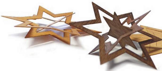
Sterne zum Auffalten: eines von vielen 3D-Furnier-Accessoires