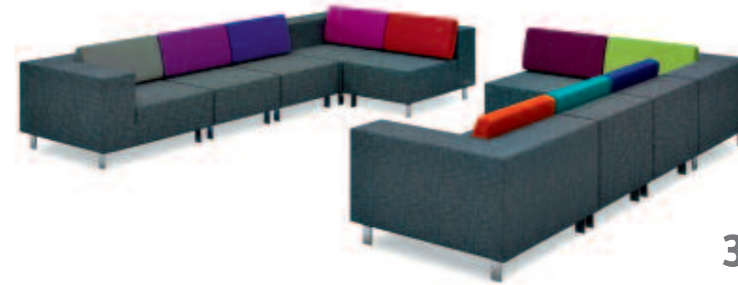
Akustikelemente umschließen Arbeits- und Loungemöbel und bewirken Ruhe im Büro in Erscheinung und Klang. • Acoustic elements include workstation and furniture and ensure a quiet office regarding appearance and sound.