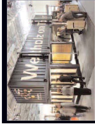
Weltholz on Tour – auf Messen und Straßen

AUSSTELLER: Heras Adronit GmbH MESSE: Bau 2011, München DESIGN/MESSEBAU: Atelier Darmböck Messebau GmbH, Neufussing bei München STANDGRÖSSE: 120 m 2