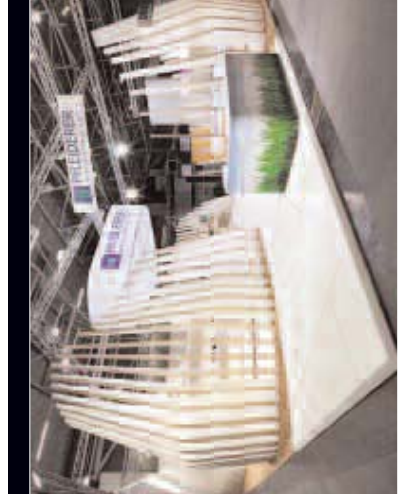
Naturformen für Bausplättchen von Pfeleiderer